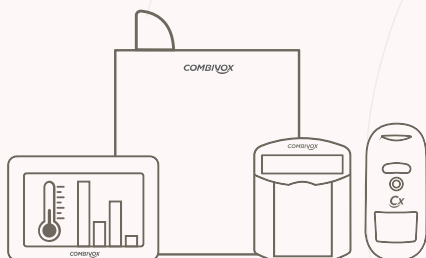
Sistema Amica Smart Combivox SmartHome